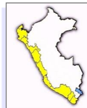
Porcentajes a Nivel Nacional